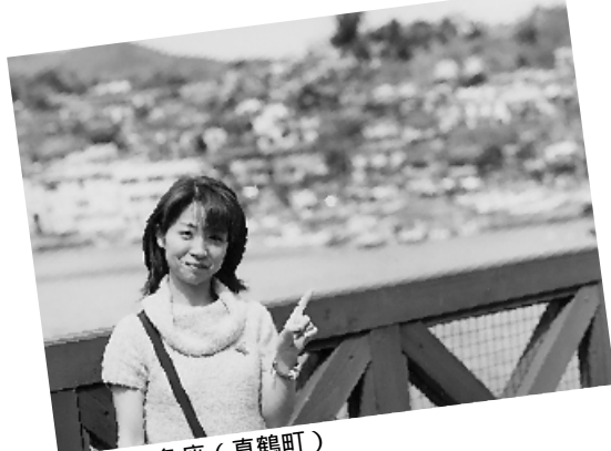
真鶴港 / 魚座 (真鶴町)