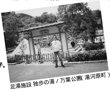
足湯施設 独歩の湯 / 万葉公園(湯河原町)

紙面スペースの都合上、 一部の方の一部の作品の ご紹介となりますが、ご了承ください。