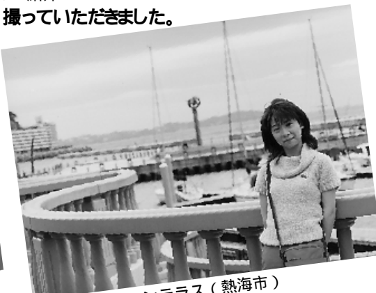
親水公園 / ムーンテラス (熱海市)